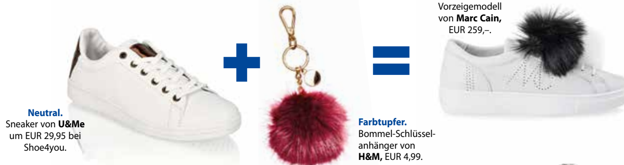
Neutral. Sneaker von U&Me um EUR 29,95 bei Shoe4you.