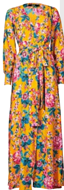
Boho-Flair. Maxi-Kleid von Bik Bok , EUR 59,99.