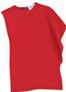
Perfekter Schwung. Top mit wellenförmigen Ärmel um EUR 440,- von Maison Margiela .