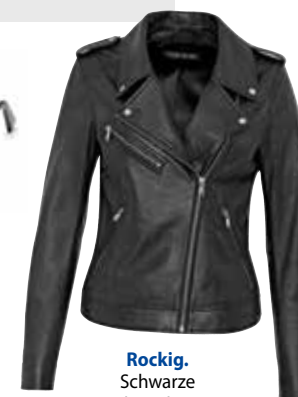
Rockig. Schwarze Lederjacke um EUR 249,95 von Hallhuber .