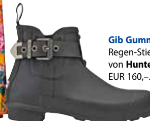
Gib Gummi! Regen-Stiefelette von Hunter um EUR 160,-.