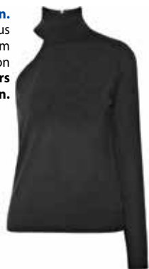
Hochgeschlossen. Rollkragenpulli aus Kaschmir um EUR 630,- von Michael Kors Collection .