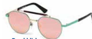
Durchblick. Pilotenbrille mit verspiegelten Gläsern um EUR 169,- von Diesel .