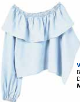
Volumen. Bluse in Denim-Optik von Mango , EUR 29,99.