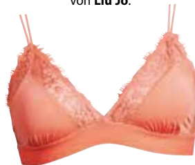
Roséfarben. Bralette um EUR 12,99 bei Bik Bok .