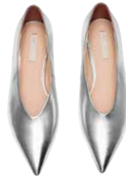
Glanzvoll. Pumps von H&M , EUR 39,99.