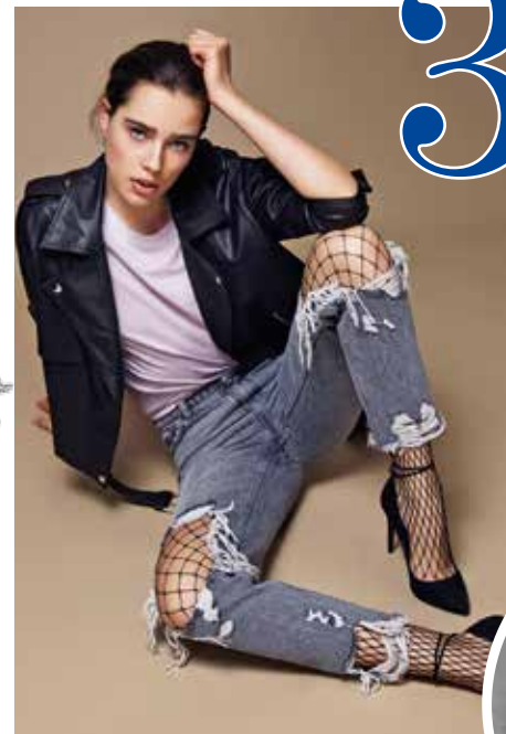
Wild. Netzstrümpfe verleihen dem Look einen gewissen Punkrock-Stil.

Grobmaschige Strumpfhosen feiern derzeit ein gewaltiges Comeback und wickeln sich wieder um das Bein. Nach Jahren im modischen Abseits lassen sie ihr verruchtes Image hinter sich und blitzen jetzt unter knöchellangen Denim-Hosen und löchrigen Jeans hervor. So sorgt der zarte Hauch von Nichts für einen rockigen, aber dennoch dezenten Hingucker in der Übergangszeit.