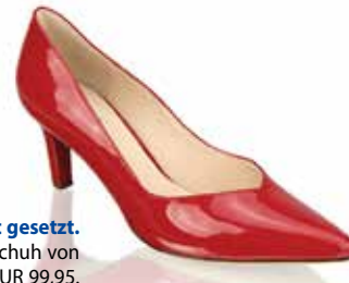
Auf Rot gesetzt. Lackschuh von Högl , EUR 99,95.