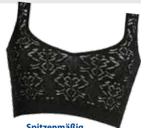
Spitzenmäßig. Oberteil um EUR 89,95 von Liu Jo .