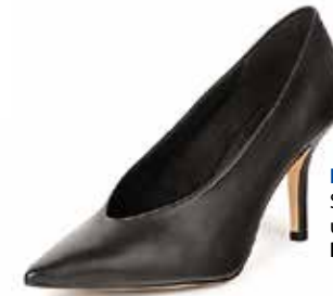
Klassisch. Schwarzes Modell um EUR 39,99 bei Bershka .