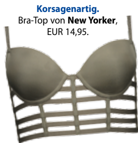
Korsagenartig. Bra-Top von New Yorker , EUR 14,95.