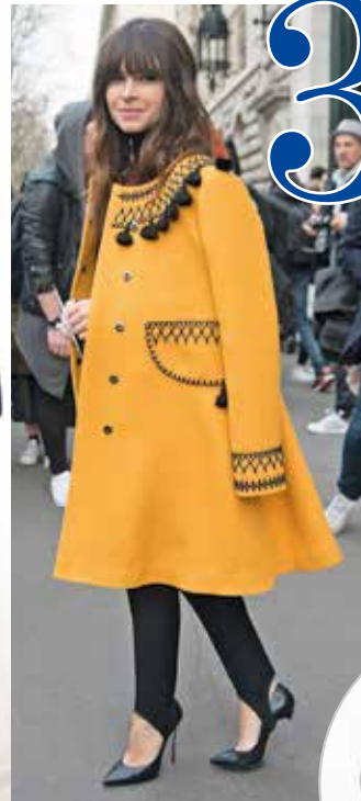
Reinsteigen bitte! Miroslava Duma trägt den Steg über den Pumps.