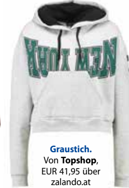
Graustich. Von Topshop , EUR 41,95 über zalando.at