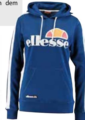
Blausehen. Kapuzenpulli um EUR 54,95 von ellesse .