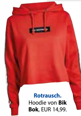
Rotrausch. Hoodie von Bik Bok , EUR 14,99.