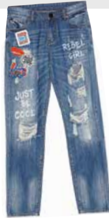
Used-Look. Boyfriend-Cut von Tezenis , EUR 25,90.