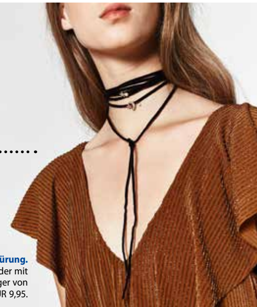
Multi-Schnürung. Lederbänder mit Anhänger von Zara , EUR 9,95.

Das Markenzeichen der 90er-Mode feiert sein Revival – die Choker Halskette ist zurück! Eng am Hals anliegend und in vielen Variationen präsentiert sich das Kropfband heute, von filigranen Schnüren über Samt bis hin zu Metallic-Reifen. Je nach Look kann das Halsband extravagant oder dezenter ausfallen. Für alle gilt: Je reduzierter das Outfit, desto auffälliger der Choker. Fazit: Wiederkehrenden Trends kann man ruhig mal eine zweite Chance geben.