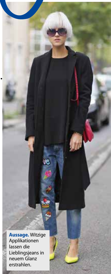
Aussage. Witzige Applikationen lassen die Lieblingsjeans in neuem Glanz erstrahlen.