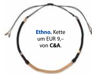
Ethno. Kette um EUR 9,- von C&A .