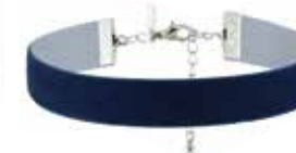
Samt. Breite Choker von Topshop , à EUR 21,95.