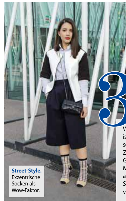
Street-Style. Exzentrische Socken als Wow-Faktor.