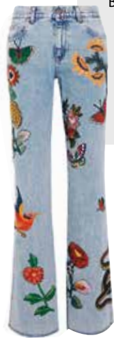
Flower-Power. 70er-Flair. Flared Schnitt von Gucci , EUR 1.890,-.

Understatement unerwünscht! Diese Saison sollen Jeans ein Blickfang sein. Extravagante Stickereien, verspielte Patches oder coole Pop-Art-Stickers – Fashionistas setzen jetzt auf individuelle Verzierungen. Ob romantisch-florale Muster oder fetzig-rockige Aufnäher, je auffälliger, desto besser. Das Coole: Man kann den Trend easy selber machen. Besonders zu schlichten unifarbene Oberseiten kommt die Statement-Jeans perfekt zur Geltung.