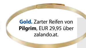
Gold. Zarter Reifen von Pilgrim , EUR 29,95 über zalando.at.

Welches ist das Must-Have-Accessoire für den Herbst?