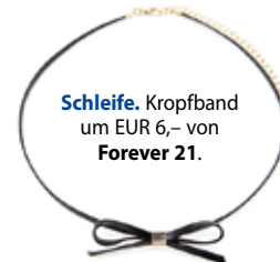
Schleife. Kropfband um EUR 6,- von Forever 21 .