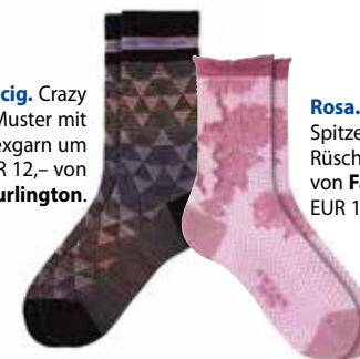
Rosa. Aus Spitze und mit Rüschenaum von Falke , EUR 12,-.