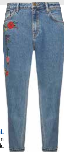
Dezentes Detail. Mom-Jeans um EUR 21,- von Primark .