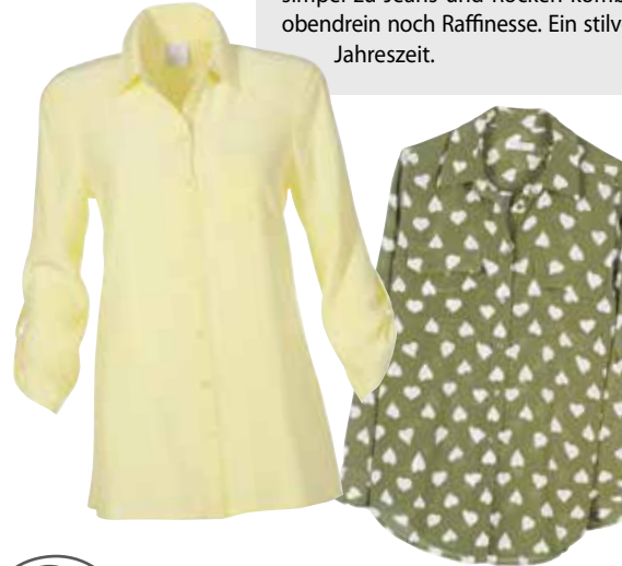
Herzig. Mit Brusttaschen um EUR 355,- von Equipment .

Seide gilt als das Wundermaterial unter den Naturfasern. Nicht nur hält sie warm im Winter, sondern kühlt uns auch an heißen Sommertagen. Wie ein Schutzschild hüllt uns der edle Seidenstoff ein und lässt warme Luft nicht an die Haut. Heuer sind bunte Blusen die perfekte Wahl für den Alltagslook. Sanfte Signalfarben und lustige Prints lassen sich simpel zu Jeans und Röcken kombinieren und verleihen Ihrem Style obendrein noch Raffinesse. Ein stilvoller Wohlfühlrend für die sonnige Jahreszeit.