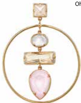
Paradisvogel. Bunte Ohrhänger um EUR 149,- von Gas Bijoux .