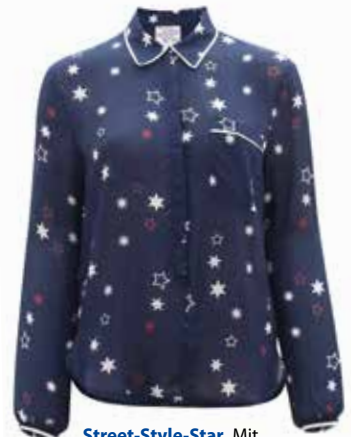
Street-Style-Star. Mit verdeckter Knopfleiste von Baum und Pferdgarten , EUR 189,-.

Seide gilt als das Wundermaterial unter den Naturfasern. Nicht nur hält sie warm im Winter, sondern kühlt uns auch an heißen Sommertagen. Wie ein Schutzschild hüllt uns der edle Seidenstoff ein und lässt warme Luft nicht an die Haut. Heuer sind bunte Blusen die perfekte Wahl für den Alltagslook. Sanfte Signalfarben und lustige Prints lassen sich simpel zu Jeans und Röcken kombinieren und verleihen Ihrem Style obendrein noch Raffinesse. Ein stilvoller Wohlfühlrend für die sonnige Jahreszeit.