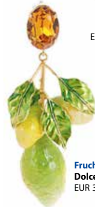
Fruchtig. Ohrringe von Dolce & Gabbana , EUR 345,-.